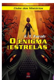
O Enigma das Estrelas