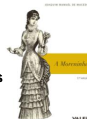
A Moreninha Joaquim Manoel de Macedo